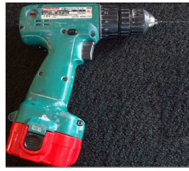
例) 正逆回転付きドリルドライバー