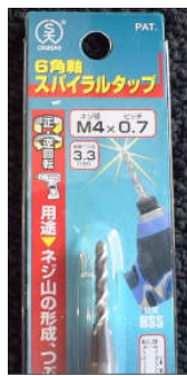
例) M4タップ(大西工業製)