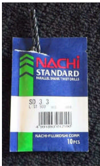
例) 3.3mmφの鉄鋼用ドリル(刃)