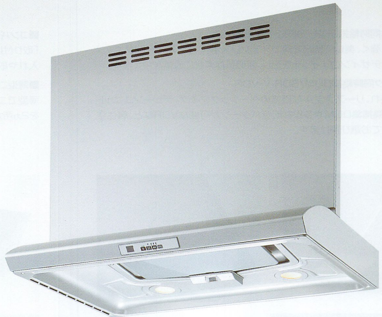
写真は別売品同時給排ユニットSCRV-905837SI使用例