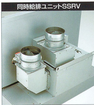
同時給排ユニットSSRV