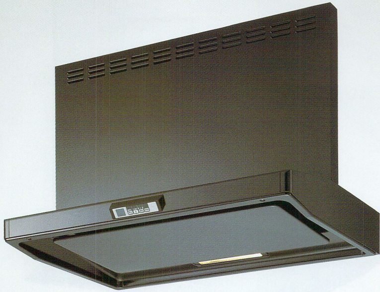
写真は別売品銅鍍幕板MP-BFD-4890BK使用例

基本色 SSR-3R-755BK/W ¥111,300(本体価格¥106,000) SSR-3R-905BK/W ¥128,100(本体価格¥122,000) シルバーメタリック SSR-3R-755SI ¥122,535(本体価格¥116,700) SSR-3R-905SI ¥139,335(本体価格¥132,700) ステンレス SSR-3R-905S ¥182,070(本体価格¥173,400) ※前幕板は別売です