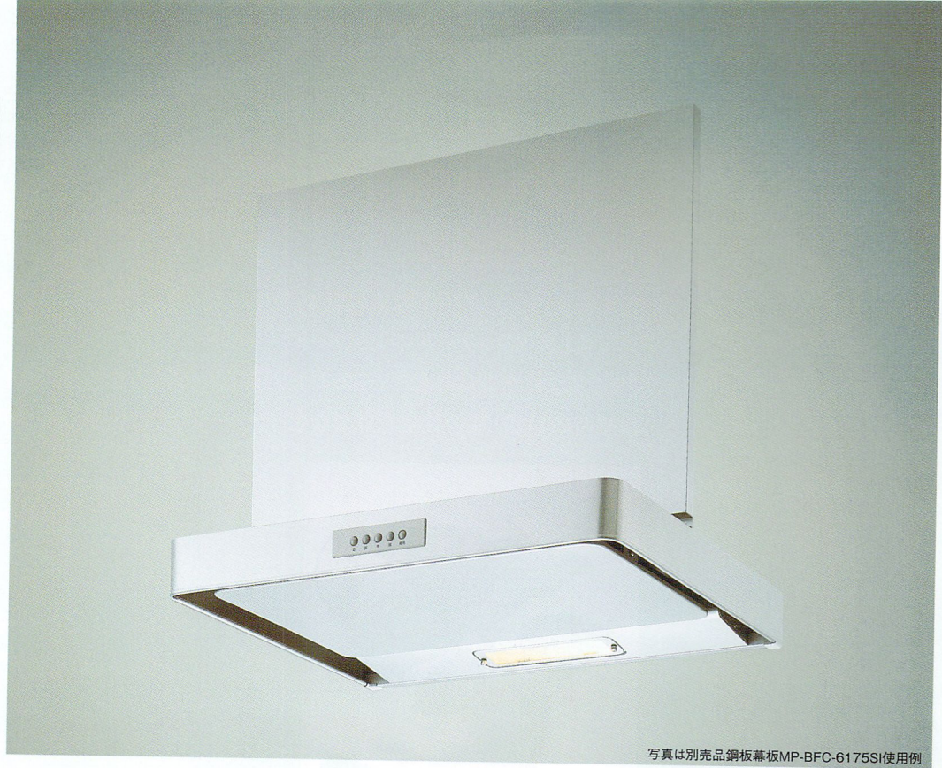
写真は別売品鋼板幕板MP-BFC-6175SI使用例

NSR-3M-601 NSR-3M-751 NSR-3M-901 オープン価格 ※前幕板は別売です