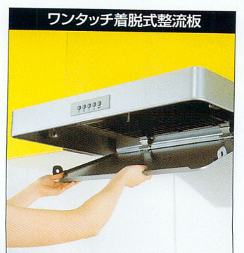
※実際のお掃除では、必ず手袋を着用してください。